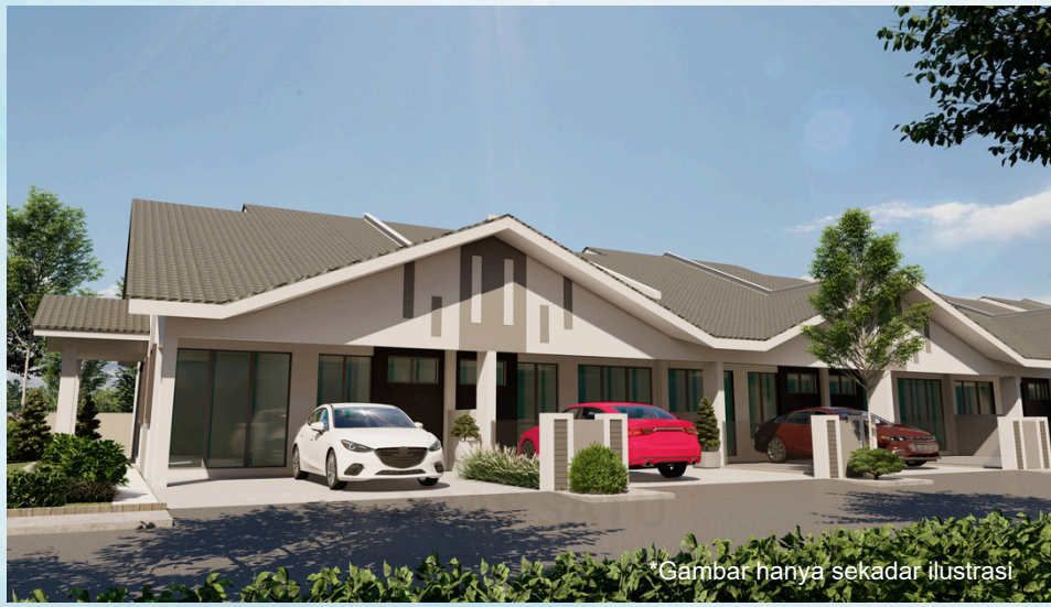
*Gambar hanya sekadar ilustrasi